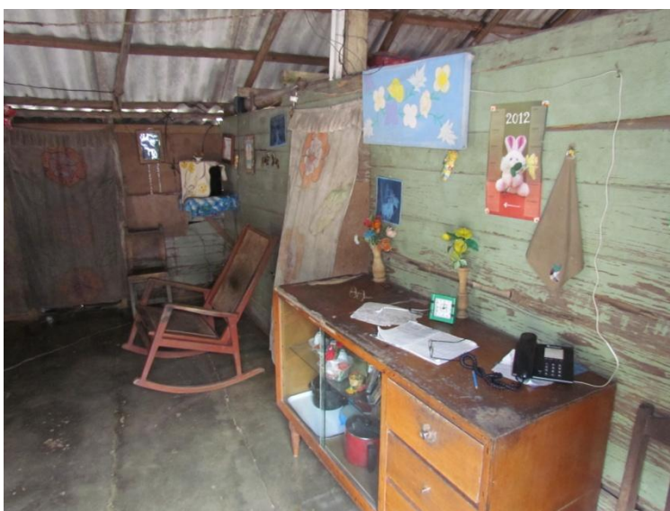
Stue hos den flinke dame.