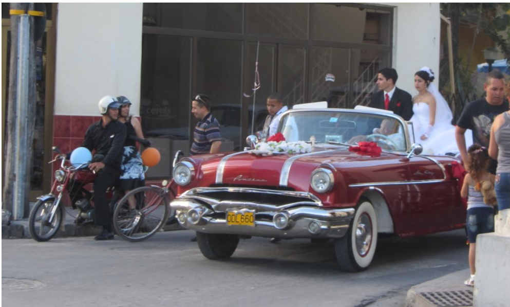
Brudeparret i Holguin før vi kunne se følgebilerne.

Vel hjemme på hotellet igen, havde vi en times pause, inden det var tid til aftensmad, som vi indtog ved poolen, kun 10,50 CUC for os alle 4 og i restauranten skulle vi give 12 CUC pr person + drikkevarer, og vi var slet ikke sultne til at skulle have den helt store buffet. Vi ville have haft en Mojito ved poolen efter maden, men det havde de ikke, så vi måtte nøjes med en Cuba Libre på værelset.