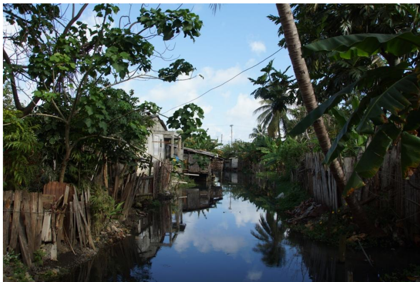
Foto Kanal i Baracoa