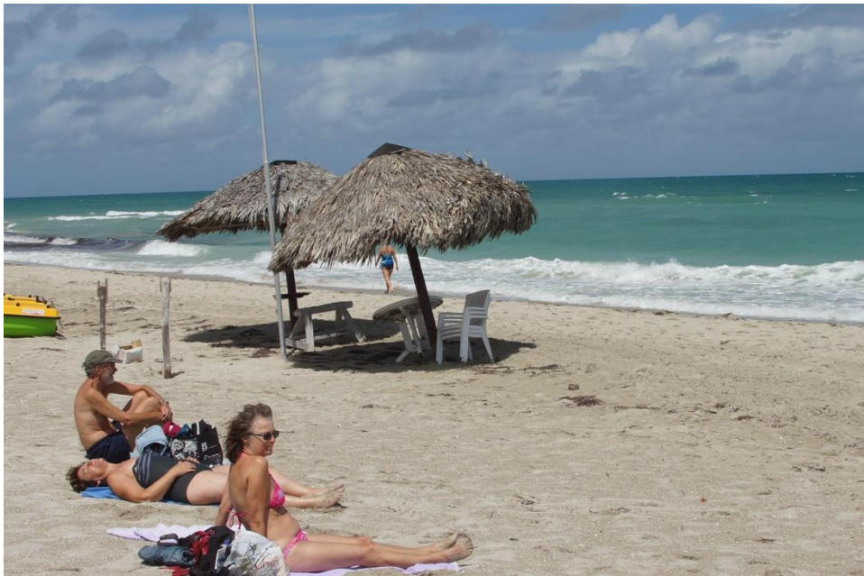
Badegæster ved Varadero

Vi forlod Varadero og fortsatte mod Havana, vi var sultne og bilen skulle også lige have et par liter benzin inden vi kunne køre i mål. Frokosten blev en sandwich ved en lille bar ved vejen, og bilen fik 10 liter af det fuldfede 94 oktan. Vi ville gerne aflevere tanken tom, da vi fra starten af havde betalt for den fulde tank. Lidt underligt, mange andre steder vi har lejet bilen skal man aflevere den fuld optanket.