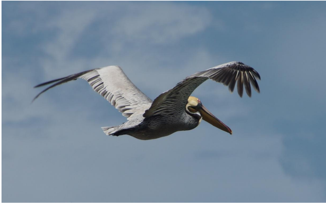
Pelikan ved stranden