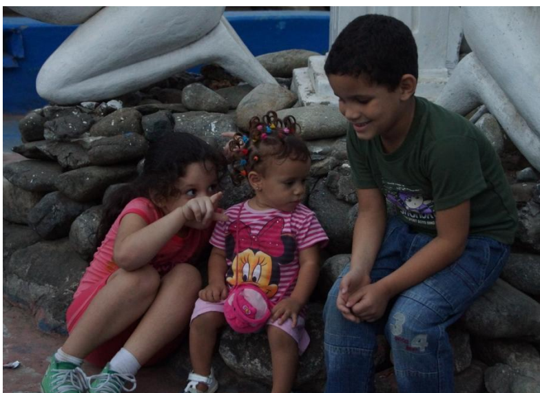
Børnene på torvet