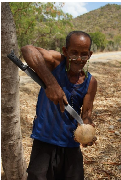
Cubaner med kokosnød og machete